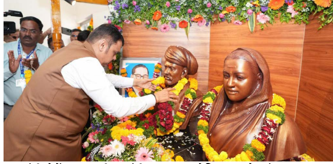
मुख्यमंत्री देवेंद्र फडणवीस यांनी महात्मा ज्योतिराव फुले यांच्या १९९ व्या जयंती निमित्ताने महात्मा फुले स्मारकात जाऊन अभिवादन करताना

दिवंगत उपमुख्यमंत्री अजित पवार यांच्या पुढाकारातून या शाळेची उभारणी झाली असून त्यांनी शाळा उभारणीच्या प्रत्येक टप्प्यावर लक्ष घातल्याचेही मुख्यमंत्र्यांनी नमूद केले. मुख्यमंत्री फडणवीस म्हणाले, छत्रपती शिवाजी महाराजांची समाधी शोधून काढून पहिली शिवजयंती